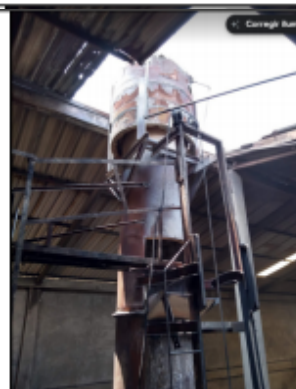
FOTO No. 6 TANQUE ENCIMA DEL HORNO