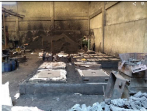
FOTO No. 3 AREA DE MOLDEO