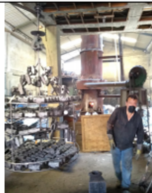
FOTO No. 4 AREA DE PULIDO