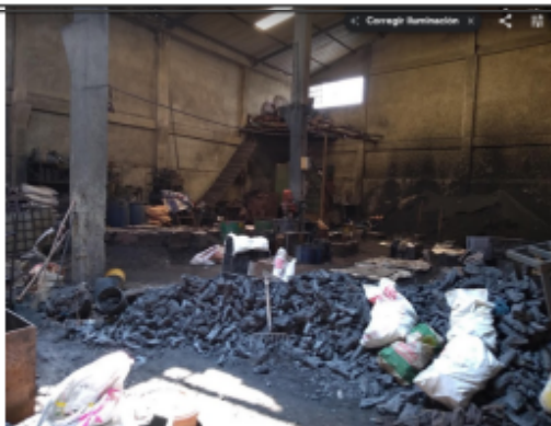
FOTO No. 5 AREA DE ALMACENAMIENTO MATERIA PRIMA